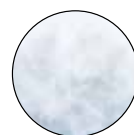
ACOLCHADO CON FIBRAS HIPOALERGÉNICAS