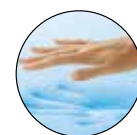
VISCOELÁSTICA CON GEL